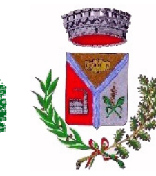
Comune di Villasor