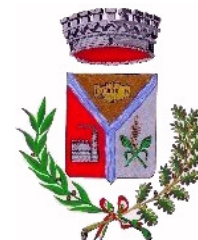
Comune di Villasor