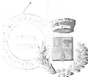
Comune di Decimoputzu