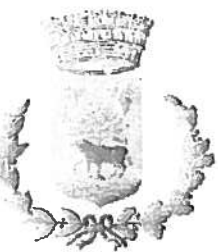
Comune di Musei