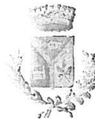
Comune di Villasor