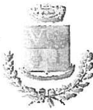
Comune di Vallermosa