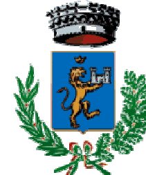
Comune di Villamassargia