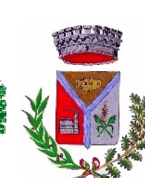
Comune di Villasor