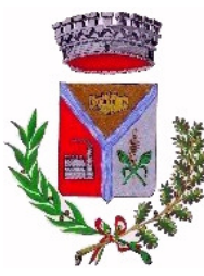
Comune di Villasor