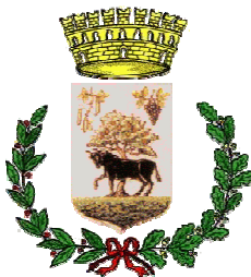
Comune di Musei