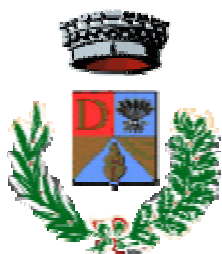
Comune di Decimoputzu