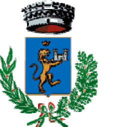
Comune di Villamassargia