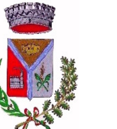
Comune di Villasor