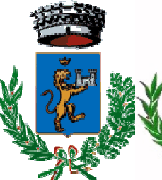
Comune di Villamassargia