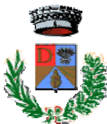
Comune di Decimoputzu