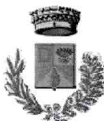
Comune di Decimoputzu