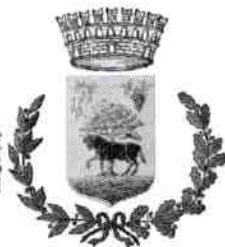
Comune di Musei