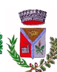
Comune di Villasor