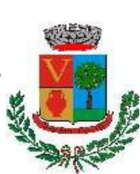
Comune di Vallermosa